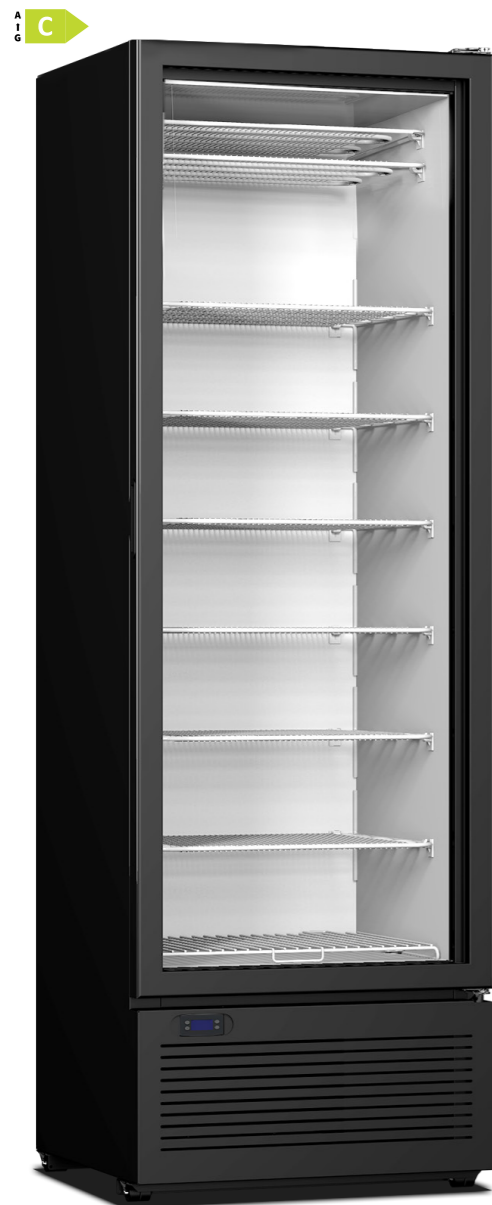
CRF 400 667 x 620 x 2018 417lt