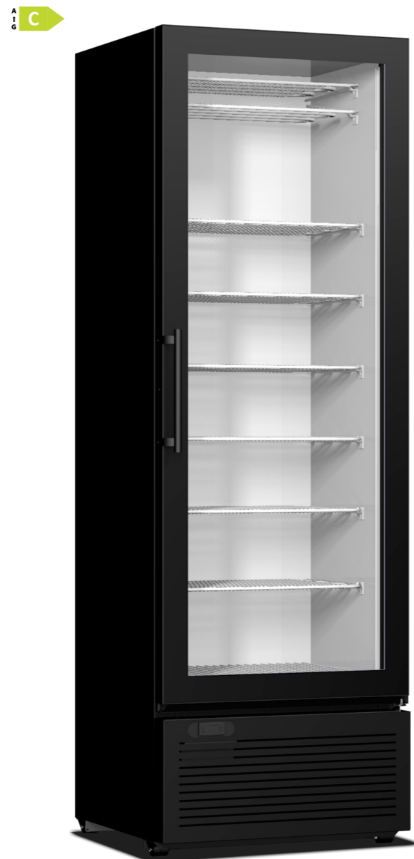
CRF 400 FRAMELESS 667 x 620 x 2018 417lt